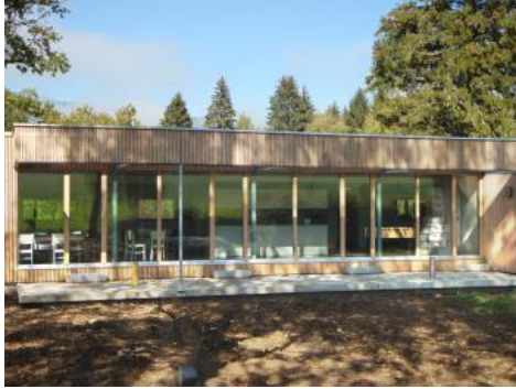
( http://cdn2.world-architects.com/files/projects/37012/images/abb7VITA_Sudansicht.jpg )

Wir freuen uns über Ihre Anregungen und Kritiken (mailto:sts@world-architects.com)!